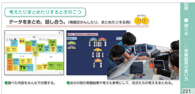
6年 p.221 協動的に考えたり整理したりする例

さらに、ICTを学習活動で使うとどのような良さがあるのかも示しており、いろいろな学びの中で 効果的に活用 していけるような構成になっています。