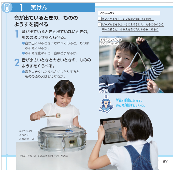
3年 p.89 動きのあるものを記録する例