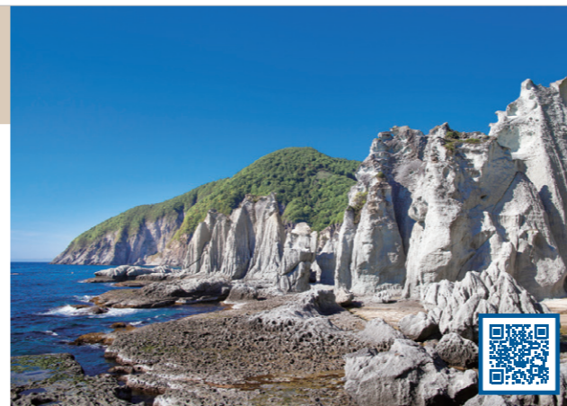
2 火山灰が固まってできた岩石からなる地形 (青森県 佐井村)