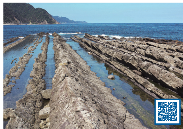
6 砂岩とでい岩からなる地層 (島根県 出雲市)