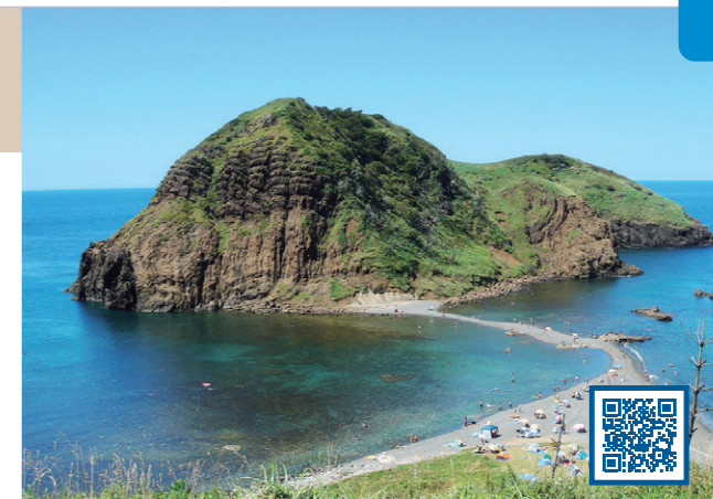
3 マグマが地中で固まってできた岩石からなる地形 (新潟県 佐渡市)