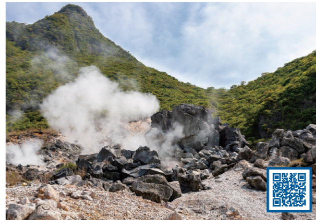
4 火山のはたらきでできた地形 (神奈川県 箱根町)