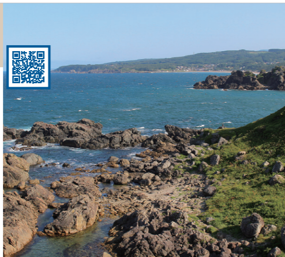
1 海底の火山からふん出したよう岩からなる地形 (青森県 八戸市)