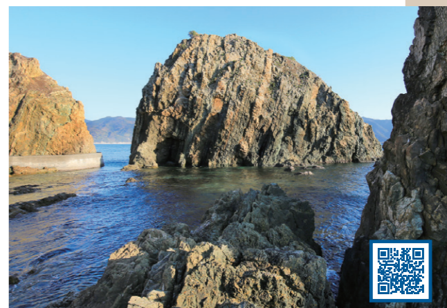
7 火山灰がたい積し、固まってできた岩石からなる地層 (愛媛県 西予市)