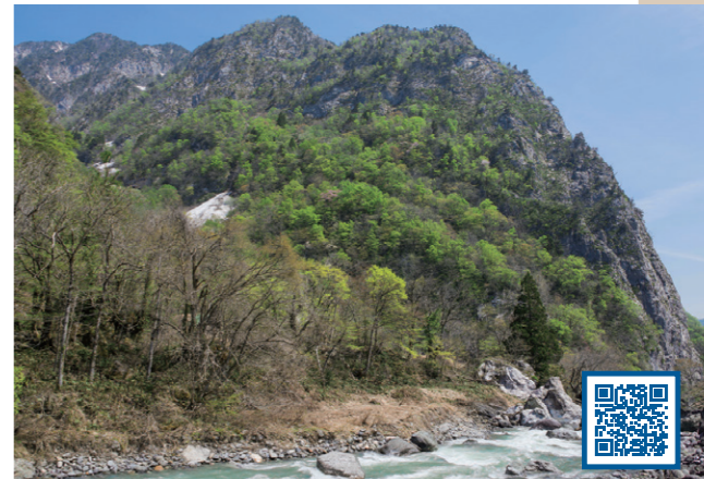
5 昔の海にすんでいた生物がたい積してできた岩石からなる山 (新潟県 糸魚川市)